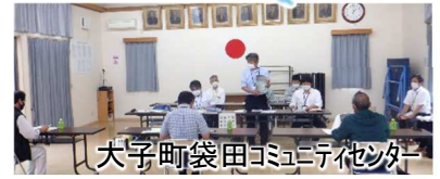
大子町袋田コミュニティセンター

また、北田気地区（大子町）、家和楽地区（常陸大宮市）、竹瓦地区（東海村）では、11月の工事開始に向け準備を進めています。