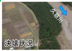
常陸大宮市下町地区 久慈川右岸 25.5k付近