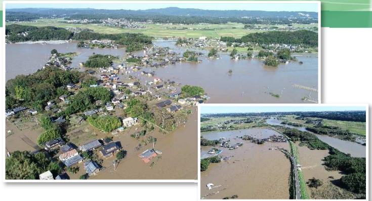
常陸太田市松栄町地先（久慈川左岸18.0k付近）

久慈川では、 数カ所で堤防が決壊し、被害家屋1,325棟、浸水面積約1,500haの被害 が発生しました。