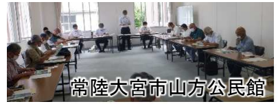
常陸大宮市山方公民館