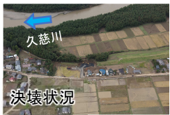
常陸大宮市富岡地区 久慈川左岸 25.5k付近