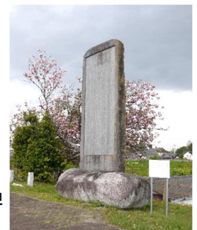
久慈川改修記念碑 （常陸太田市）

地域防災力の向上を目指した水害記録の伝承を目的に自然災害伝承碑（国土地理院）の申請を行い、4基の石碑が公開されました。 ※次号で詳しくお知らせします。