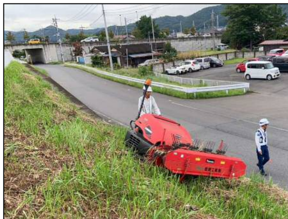
機械による刈草の集草作業