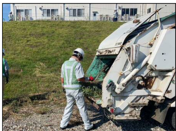
集草後のパッカー車への積込作業