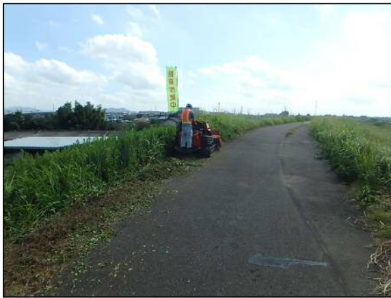
ハンドガイド式草刈機による除草作業