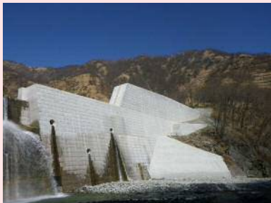
H29 松木川一号砂防堰堤改築工事