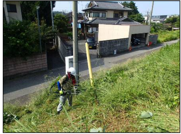
肩掛式草刈機による障害物回りの先行刈り作業