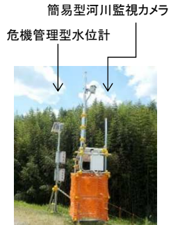
久慈川左岸27.0k付近 常陸大宮市塩原地先決壊箇所

住民の適切な避難判断のための情報提供を目的に、リアルタイムの河川状況を画像で伝えるための低コストで設置が容易なカメラを 決壊箇所3箇所に設置 し、出水時の状況を把握できるようにしました。