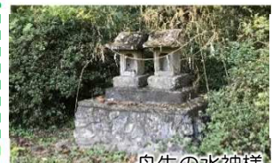
舟生の水神様 （久慈川右岸 常陸大宮市舟生地先）

久慈川流域では、水害から集落を守ってくれる神様として、また地域に恵みをもたらす神様として水神さま信仰が広範に見られ、現在も続いているものが多くあります。それぞれの集落では持ち回りで当番を決めて小規模な祭礼を行っているようです。