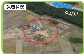
令和元年10月撮影（被災直後）