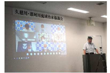
常陸河川国道事務所挨拶

※緊急治水対策プロジェクトは、沿川の自治体、気象台等と連携して緊急的に進めている取り組みに対して、流域治水プロジェクトとは、流域内のあらゆる関係者（国、県、市町村、企業、住民等）により、中長期的な対策を計画的に進めていく取り組みです。