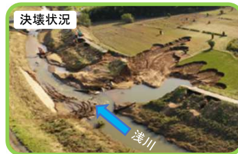
令和元年10月撮影（被災直後）