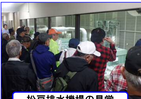
松戸排水機場の見学