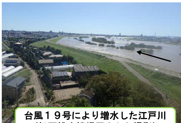
台風19号により増水した江戸川 (松戸排水機場屋上から撮影)

また、10月25日(金)にも台風21号の影響による大雨となり、松戸市、流山市でも非常に強い雨が降りましたが、どちらも江戸川や坂川の氾濫による浸水被害はありませんでした。