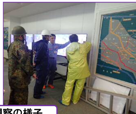
松戸市長視察の様子