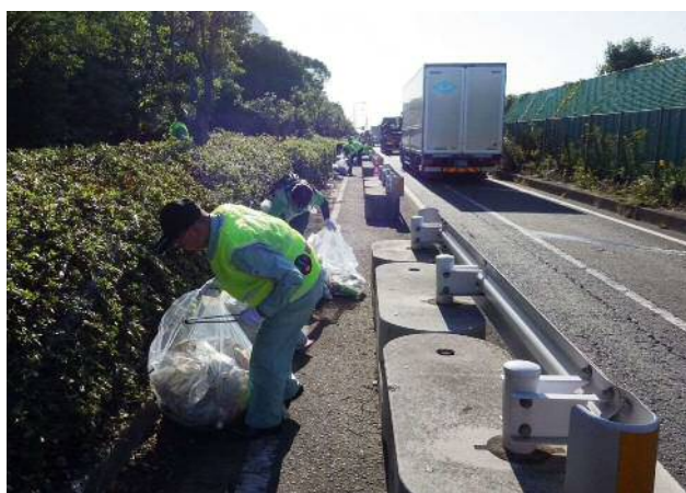
▲ 清掃活動の状況 (国道357号)

平成23年度より毎年開催し、9回目となった今回は、121団体 354名の方にご参加いただき、ゴミのない東扇島を目指し、国道357号や川崎マリエン及び東扇島東公園周辺道路の清掃活動を実施しました。また、利用者のマナー意識向上を呼びかける地元小学校児童が制作したごみのポイ捨て防止の啓発横断幕を掲示しました。