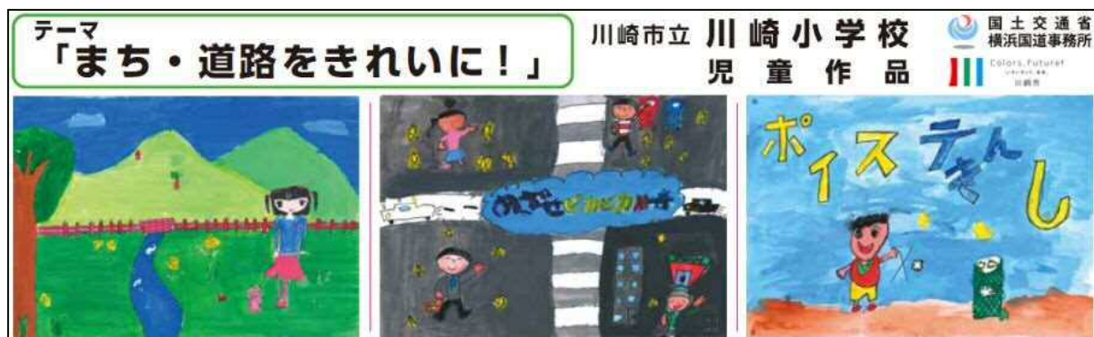
▲ 啓発横断幕の例 (地元の小学校児童が製作した絵画を使用)