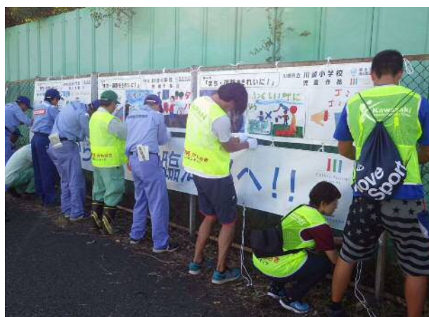
▲ 啓発横断幕の掲示状況