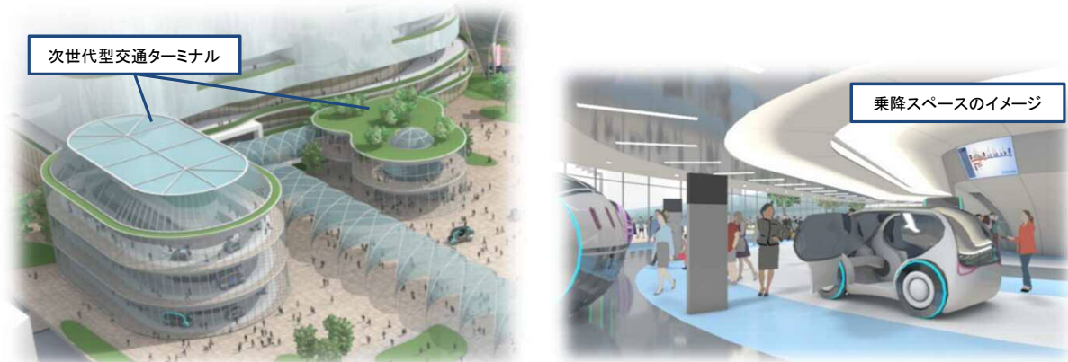
次世代型交通ターミナルのイメージ

http://www.ktr.mlit.go.jp/toukoku/toukoku00130.html