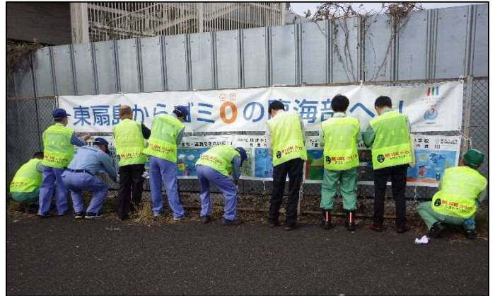
3. 啓発横断幕の設置状況