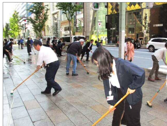
第50回(令和元年5月10日)の一斉清掃状況 (沿道店舗従業員による歩道敷石の清掃)

※銀座通連合会：銀座通り、晴海通りを中心とした 約250店舗で組織する地域企業連合