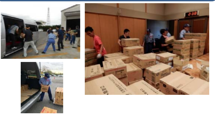
●物資支援 (関東地方整備局は救援物資を千葉県内10市町へ輸送 R1.9.13・914)