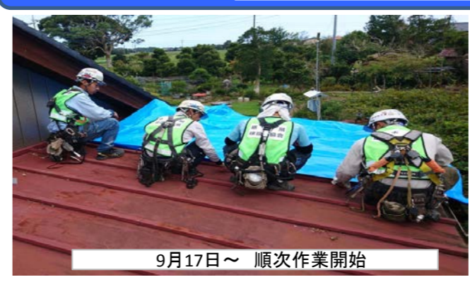
9月17日～ 順次作業開始