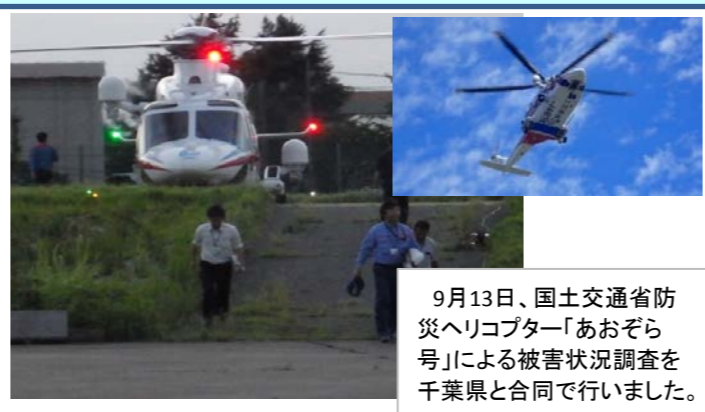
9月13日、国土交通省防災ヘリコプター「あおぞら号」による被害状況調査を千葉県と合同で行いました。