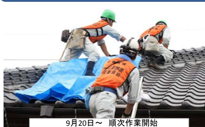
9月20日～ 順次作業開始