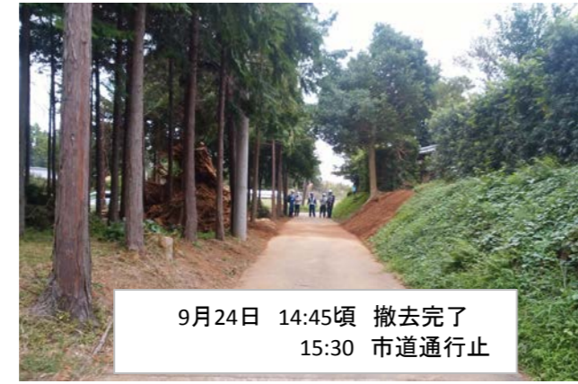
9月24日 14:45頃 撤去完了 15:30 市道通行止