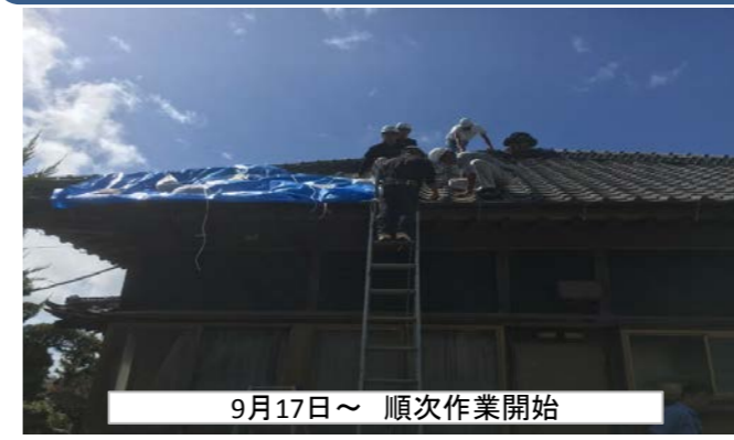
9月17日～ 順次作業開始