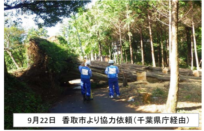
9月22日 香取市より協力依頼(千葉県庁経由)