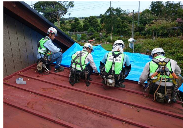
【山武市:ブルーシート設置状況】