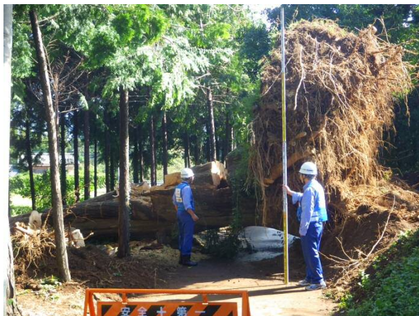
【香取市:市道における倒木除去を実施】

関東地方整備局では、香取市内の停電の早期解消に向けた市道の倒木除去等についての技術支援を行っています。