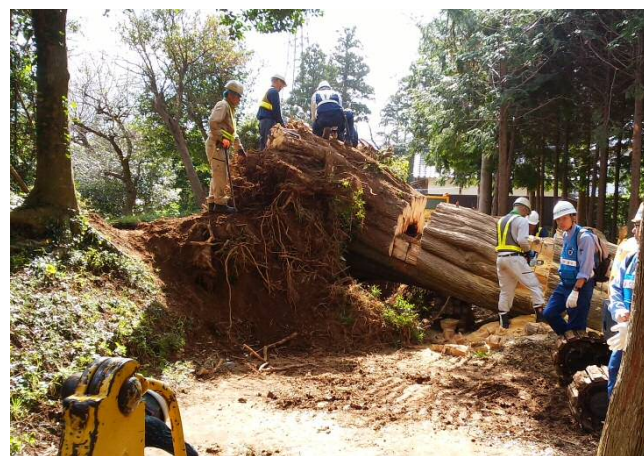
【香取市:市道における倒木除去を実施】