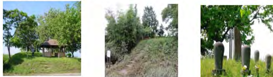
役場跡 雷電神社跡 延命院跡

遊水地内には、今でも旧谷中村の人々が生活していた跡、高く盛り土した施設の跡(役場跡、雷電神社跡、延命院跡)が残っています。