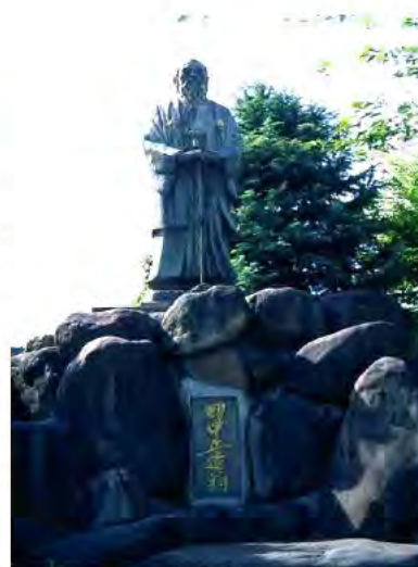
栃木市藤岡町(新開橋脇)

議員辞職後は、谷中村廃村に反対し、村民とともに村を守るために闘い、73歳の生涯を閉じました。