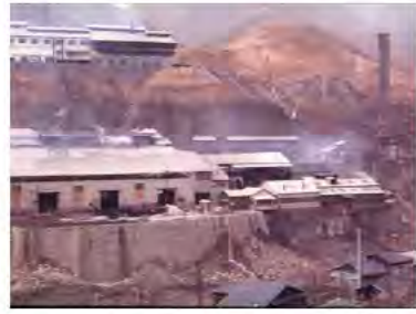
明治時代足尾銅山の様子

足尾銅山は、明治に入り新しい銅の埋まった場所も発見され、銅生産は急に増えました。