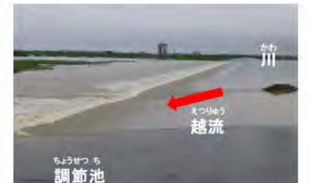
越流堤からの流れ込む様子