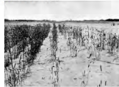
渡良瀬川の水があふれ、田畑の作物が枯れた様子

そのため、山林の伐採と排煙が主な原因で植物は育たなくなり、はげ山となった足尾の山は水を吸わなくなり、山に降った雨の流れが速くなりました。