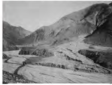
はげ山となった足尾の山

足尾銅山は、明治に入り新しい銅の埋まった場所も発見され、銅生産は急に増えました。