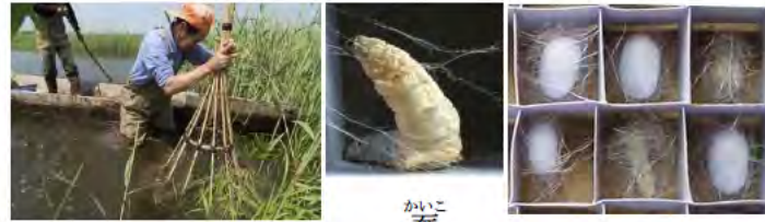
ザンブリ漁 蚕 マユ

遊水地になる前、そこに遊水地の約1/3を占める谷中村があり人々が生活していました。洪水被害が起こりやすい地域でしたが、村人は周囲に堤を築き農業、養蚕業、漁業などを営み生活していました。