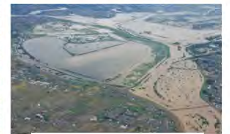
洪水時の渡良瀬遊水地

[利水] ハート型の貯水池(谷中湖)に、飲み水やお風呂、洗濯などみんなが利用する水を貯めておきます。