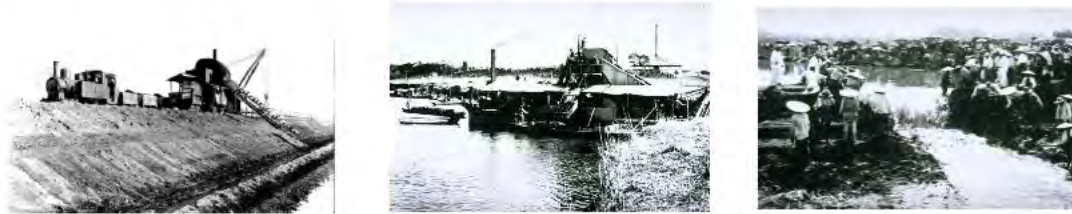
渡良瀬川・遊水地化の工事の様子

農作物や魚への被害は、渡良瀬川の洪水によって広がりましたので、洪水対策の一つとして、渡良瀬川の流れを変え、谷中村と周辺の土地に堤防を築いて遊水地をつくりました。