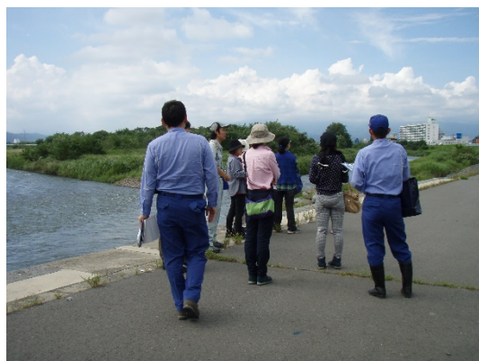
高松地区事業実施地