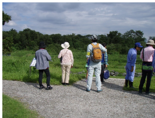
かな川水辺の楽校