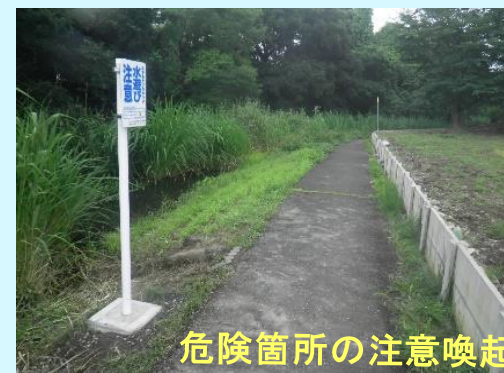
危険箇所の注意喚起

川には流れが急な所や深い所等の危険な場所があります。また、突然の大雨により急激に増水して危険な状態になることもあります。