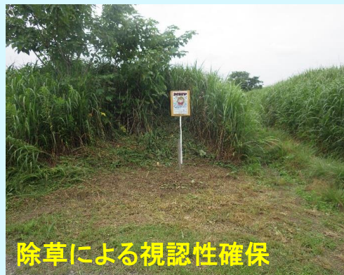
除草による視認性確保