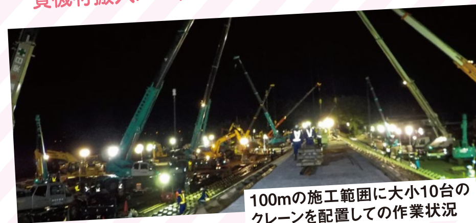
100mの施工範囲に大小10台の クレーンを配置しての作業状況