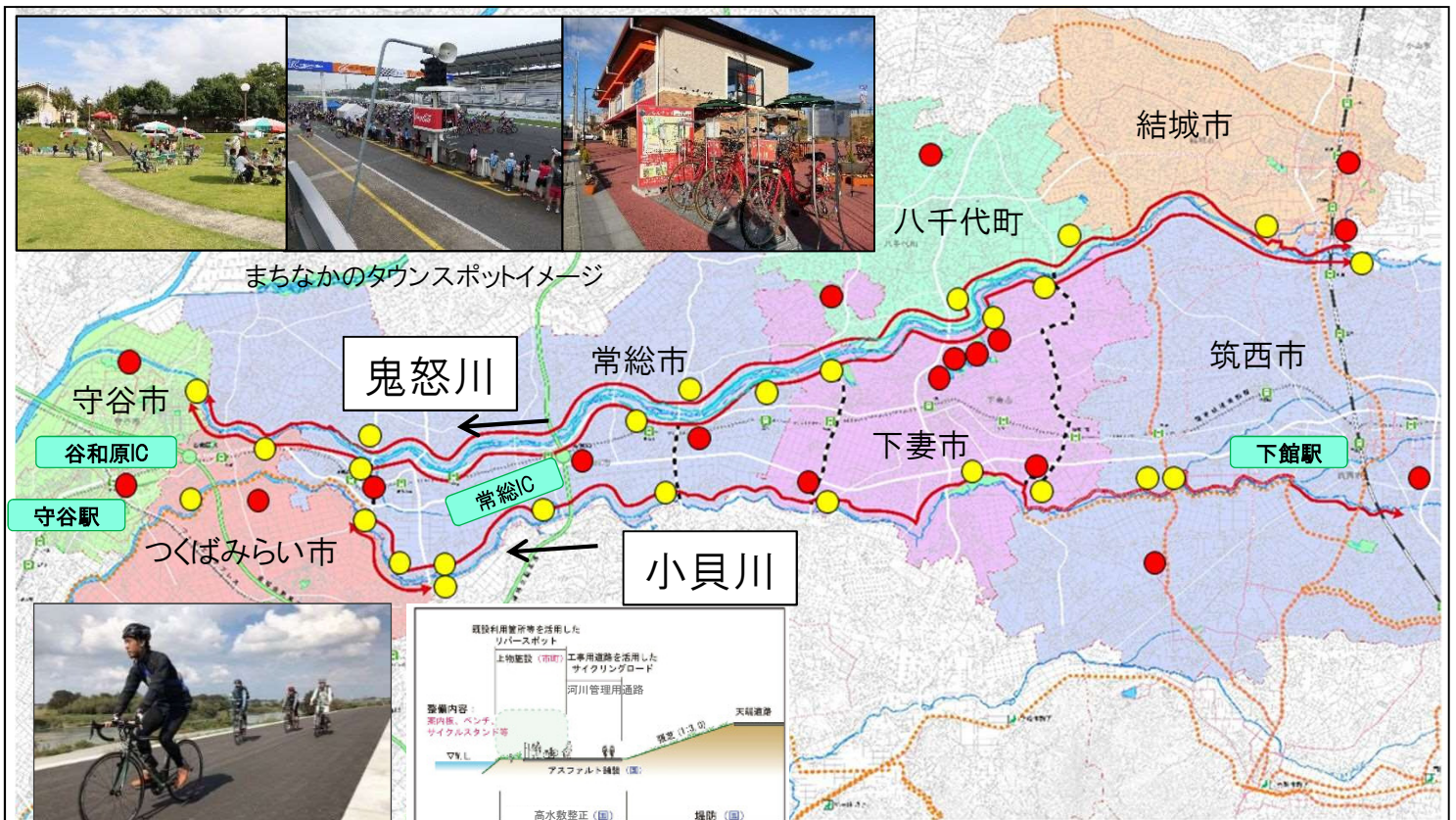
工事用道路を活用したサイクリングロード、河川敷のリバースポット整備イメージ

結城市・下妻市・常総市・守谷市・筑西市・つくばみらい市・八千代町：リバースポット上面整備 (案内板、ベンチ、サイクルスタンドなど)