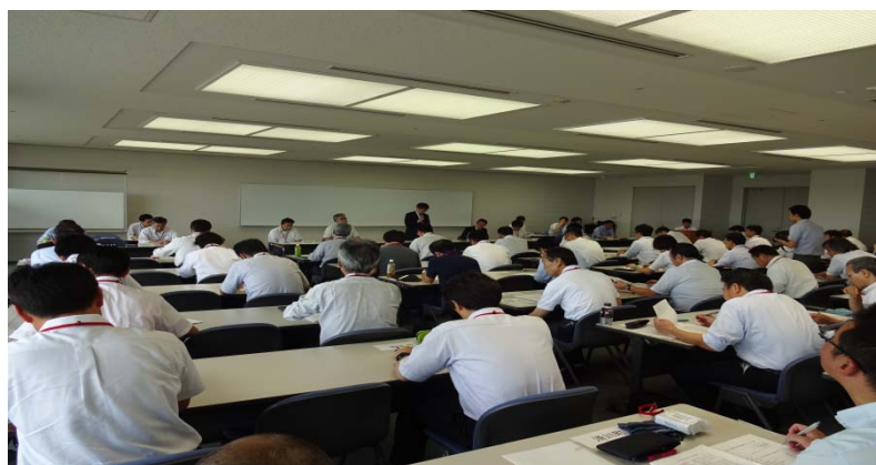
平成29年度第1回道路メンテナンス会議の実施状況（H29.6.27）