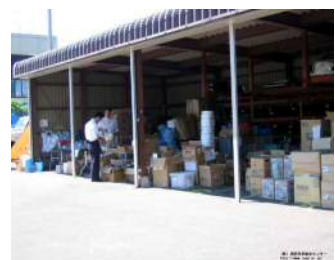
⑥防災備蓄倉庫の設置 (柏崎市総合福祉センター)