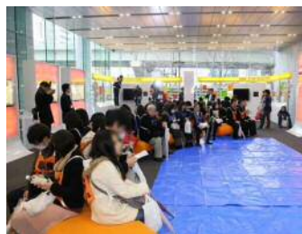
①施設内在勤者の残留対策