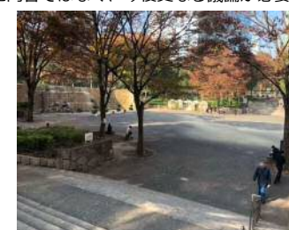
⑤広域避難者の受け入れ(広域避難場所) (新宿中央公園)