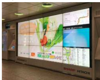
⑦情報の提供 (新宿駅西口)