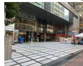
④一時集合場所の提供 (日本橋プラザビル)