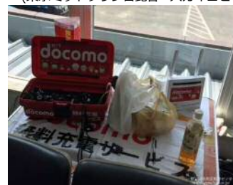
⑧Wifi環境・充電スポットの提供 (朝倉市役所)