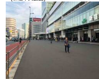
⑩緊急車両駐車スペースの提供 (バスタ新宿)

デッキと再開発が一体となった防災機能の向上と 各地からの支援の一時受け入れ体制に係る仕組みづくりが必要であり、今後、更なる検討が必要