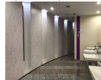
⑨トイレの提供 (民間ビルのトイレの開放)