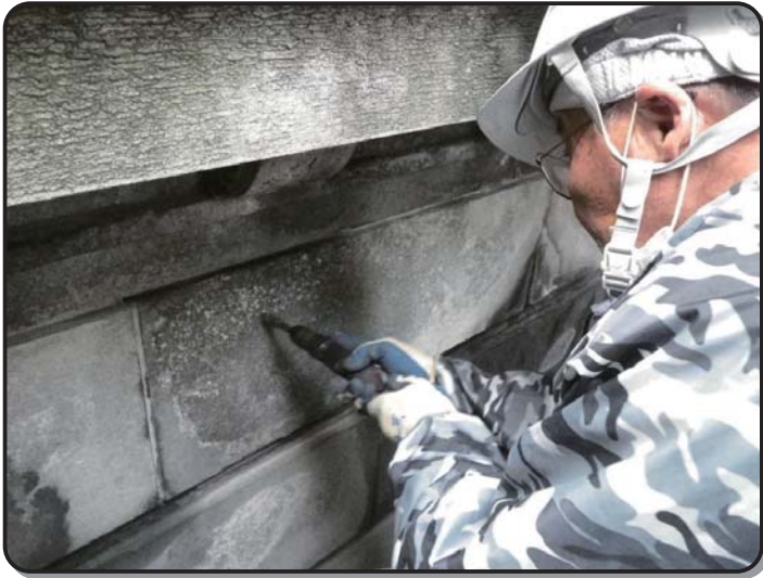
▲はがし取り作業の状況

橋の表面の石がひび割れたり、はがれかけたものは、そのままにしておくとそこから水が橋の中にしみ込んだり、大きくはがれてしまふ原因になるため、少しずつ、悪いところをはがしていきました。こうすることで、石の丈夫できれいな面が新たに出てきます。