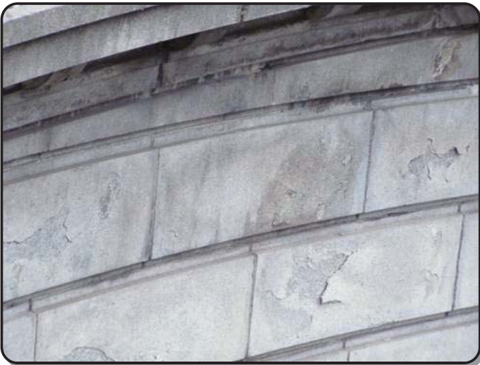
▲橋の側面の汚れ（黒ずみ、ひび割れ）