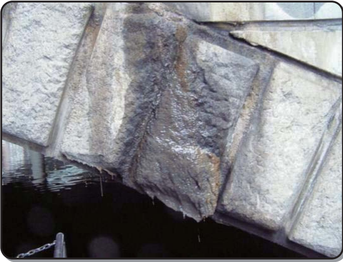
▲橋の側面の汚れ（水のしみ出し）

橋の防水を行ったことによつて、水のしみ出しをなくすことができました。そこで続いて、橋の側面や裏面にある汚れや剥離の補修を行いました。