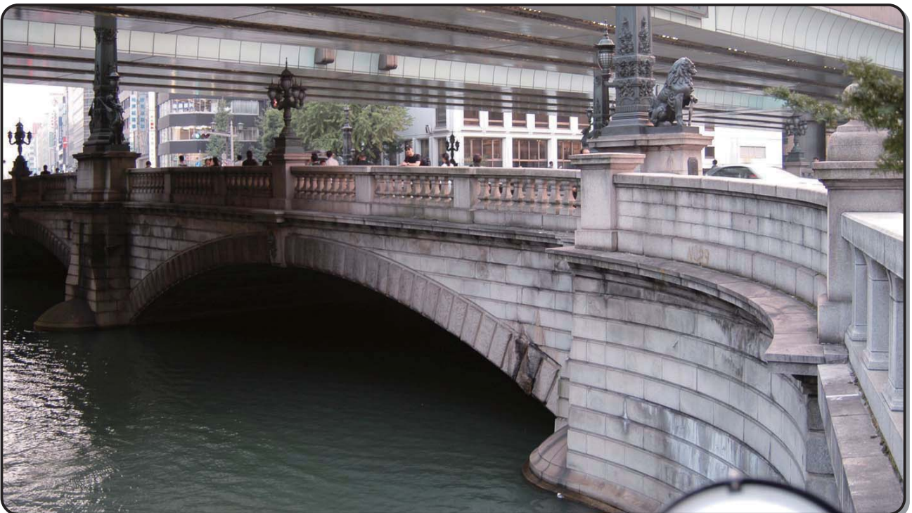
▲補修工事前の日本橋