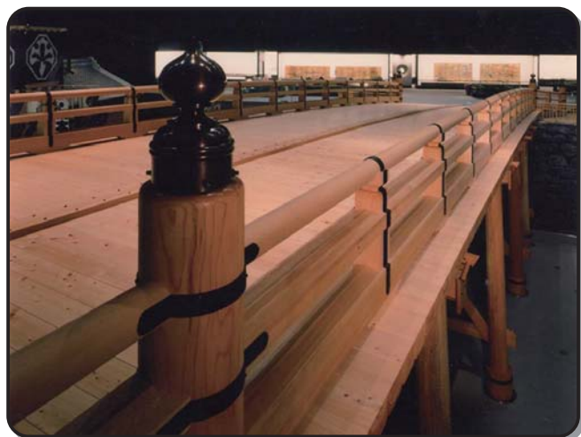
ばくまつき ▲幕末期の日本橋