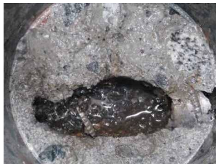
グラウト未充填の状況