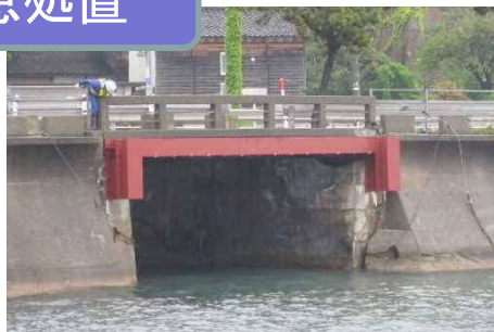
応急処置後の状況