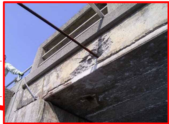
(海側) PC鋼棒 φ23, L=3m突出