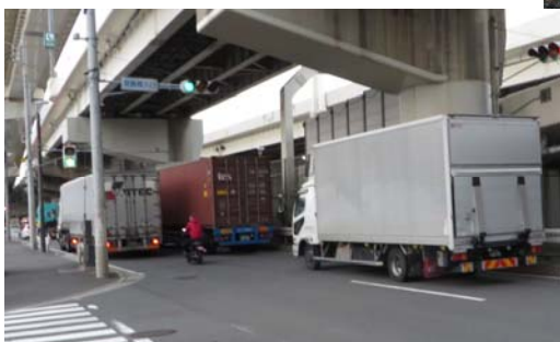
横浜市中心部方面へ向かう物流車両