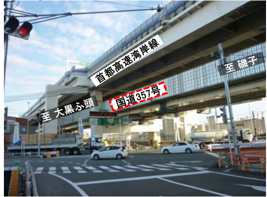
写真②: 本牧ふ頭出入口交差点