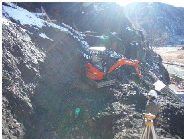
▲久蔵口山腹基礎工事 ：2号かご砕工の床付状況