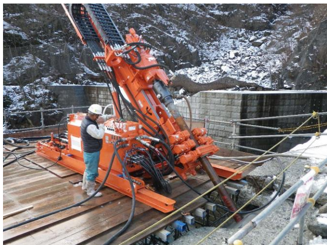
▲松木川一号砂防堰堤改築工事 ：グラウンドアンカー施工状況