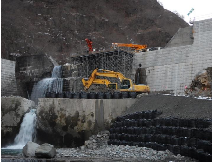
H29松木川一号砂防堰堤改築工事