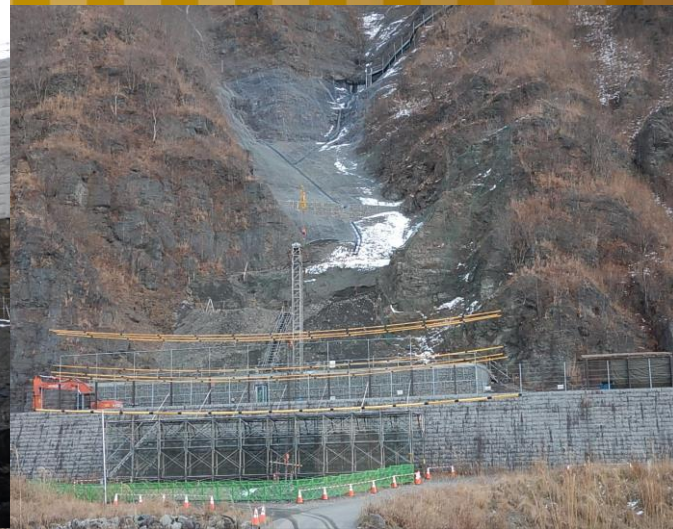
H29久蔵口山腹基礎工事