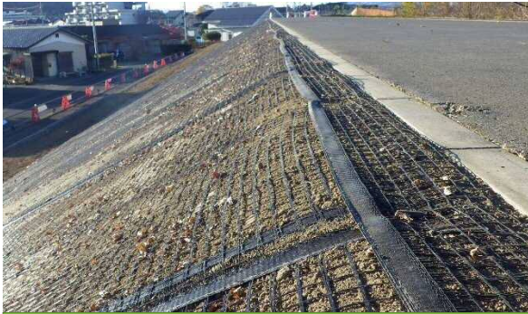
補強シート設置状況（この上に芝を張ります）

近隣の皆さまには、ご理解とご協力をいただきありがとうございました。なお、きれいになった芝の堤防を出来るだけ長く維持していきたいと思っておりますので、新たに芝を張った箇所には立ち入らないようご協力よろしくお願いいたします。