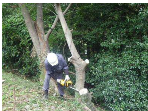
河川内樹木の伐採状況

年間を通じて管内全域で実施する維持管理工事です。河川内樹木の伐採や管理用通路の補修等を実施してまいります。