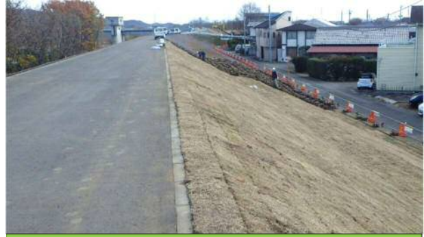
張芝実施状況（芝の下に補強シートがあります）