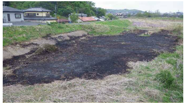
平成30年4月16日の火災あと 場所:桐生川左岸八坂橋下流の高水敷

堤防や高水敷での枯れ草火災などを発見した場合は、直ちに消防署へ連絡(119番通報)をお願いします。