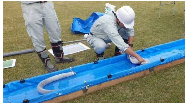
模型による油の除去・処理の実演

桐生出張所管内においても、水質汚濁事故が発生する事があります。河川に油が浮いている、大量の魚が浮いているなど異変を発見した場合には、最寄りの出張所や市へ連絡をお願いいたします。