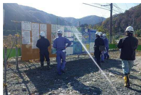
工事看板等の掲示内容も確認します