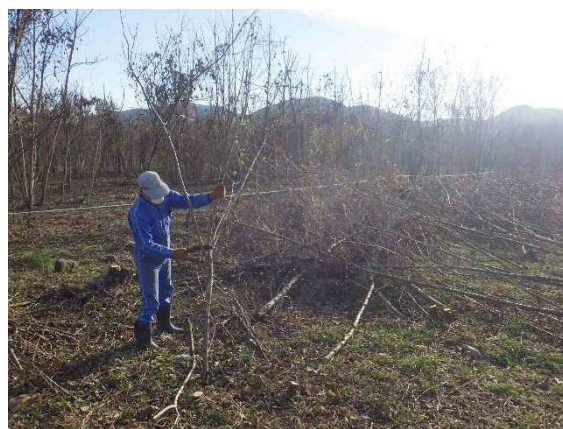
樹木の伐採実施状況