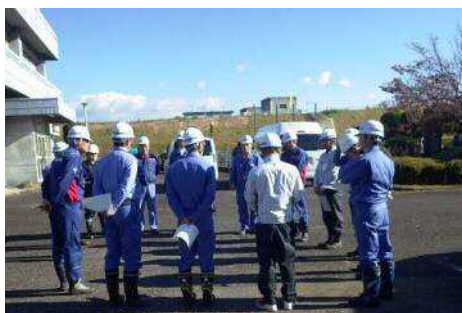
工事安全パトロール実施状況

今回のパトロールでは、桐生労働基準監督署、各工事の施工業者、渡良瀬川河川事務所及び出張所の職員が、各工事現場を点検し、安全対策として改善すべき点や、他の工事の模範となる点などを確認しました。引き続き安全対策に努め、今年も無事故・無災害での工事完成を目指します。