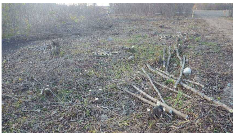
伐採が完了した区画の状況

今年度は25組の方々に伐採をして頂き、伐採した樹木については参加者が持ち帰り、薪などに活用して頂く事となっております。 作業期間は平成31年2月28日までの 予定です。