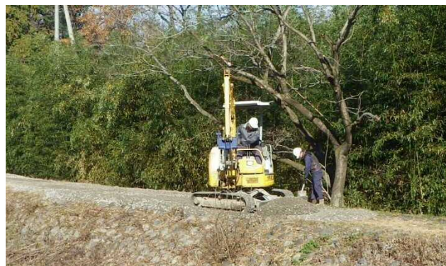
管理用通路の補修状況