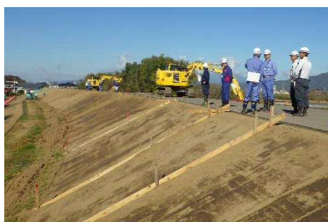
法面補修工事の現場をパトロール