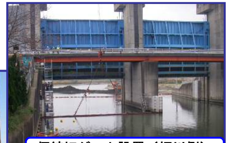
仮締切ゲート設置 (坂川側)