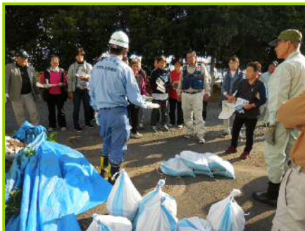
土のう積みの説明状況