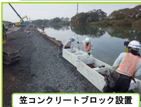
笠コンクリートブロック設置