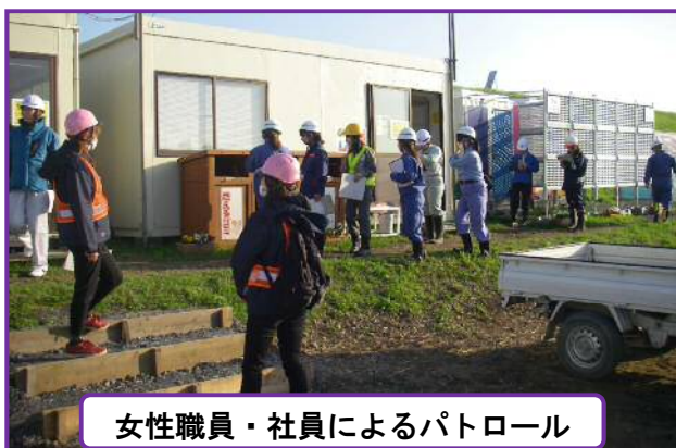
女性職員・社員によるパトロール

今回は合計14名の女性に参加して頂き、職場環境について色々指摘・改善点を頂きました。指摘事項を踏まえて誰もが快適に働ける現場を目指していきたいと思えます。