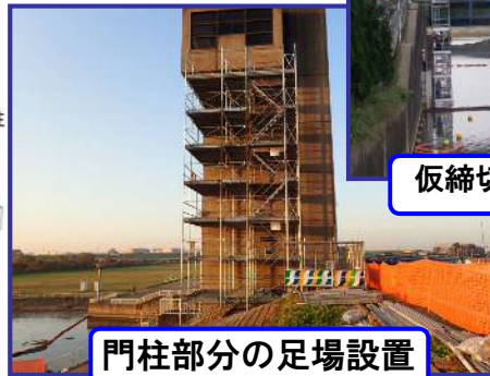
門柱部分の足場設置