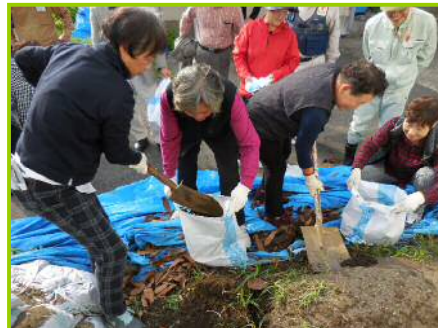
参加者による土のう作り状況