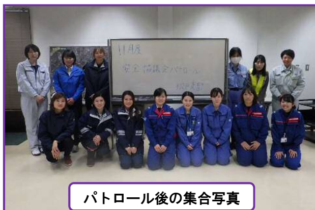
パトロール後の集合写真