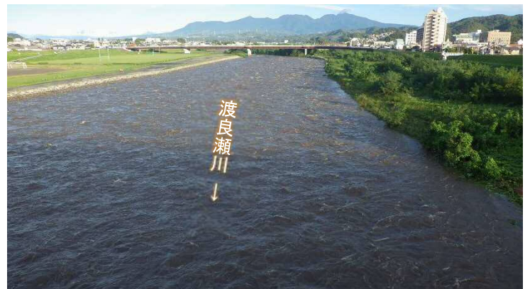
10月1日6時30分頃の渡良瀬川 中通り大橋から上流方向