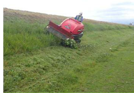
機械式除草実施状況

年間を通じて管内全域で実施する維持管理工事です。10月上旬までに今年度2回目の堤防除草が終わりました。ご協力ありがとうございました。