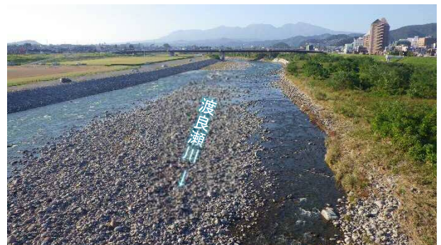
平常時の渡良瀬川 中通り大橋から上流方向

桐生出張所管内では、河川巡視を実施しましたが、堤防等への被害は確認されませんでした。