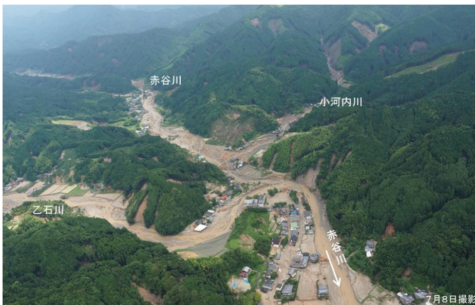
赤谷川、小河内川、乙石川合流点付近における流木による被害（福岡県朝倉市）