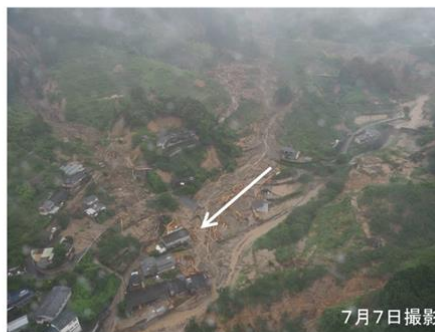
豪雨により多量の土砂と流木が流出 （福岡県朝倉市北川付近）