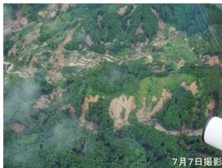
山腹斜面で多数の崩壊が発生 （福岡県朝倉市北川付近）