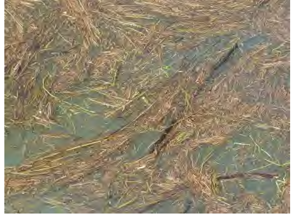
漂流する萱・草等