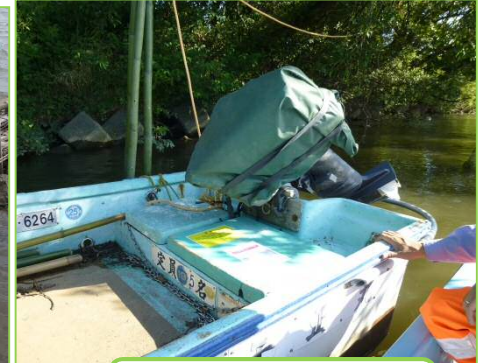
9/20 不法係留船調査 ・撤去警告