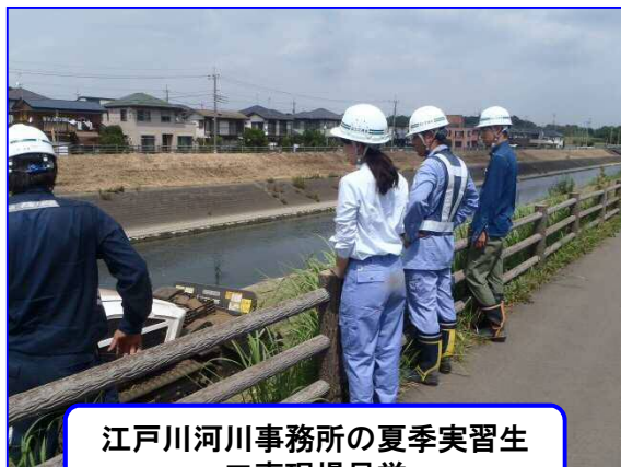
江戸川河川事務所の夏季実習生 工事現場見学

また、8月29日（水）にもH29・30松戸河川維持工事受注者である金杉建設(株)の夏季実習生(インターン)8名を迎えて、松戸排水機場の見学並びに河川事業の説明を行い、8月期の工事安全パトロールを体験してもらいました。