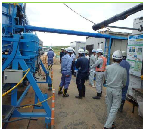
工事安全パトロールの様子

今回、3工事を対象に作業状況や安全対策等を確認しましたが、事故につながるような案件は発見されませんでした。