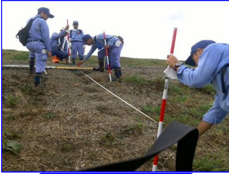
江戸川の点検状況