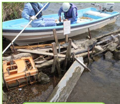
8/16 不法棧橋調査 ・撤去警告

これらが河川内にあると、洪水時に流されて河川施設や橋梁等に被害を及ぼしたり、油漏れ等の水質事故を発生させる恐れがあります。今後も不法係留船が無くなるよう厳しく取り締まって参ります。