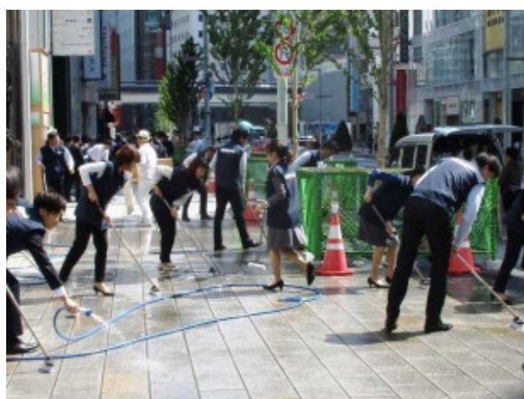
第48回(平成30年5月11日)の一斉清掃状況 (沿道店舗従業員による歩道敷石の清掃)

銀座通連合会：銀座通り、晴海通りを中心とした 約250店舗で組織する地域企業連合