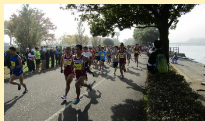
戸田マラソンin彩湖（戸田市）

荒川沿川の市町村でも「戸田マラソンin彩湖」（戸田市）や「小江戸川越ハーフマラソン」（川越市）、「熊谷さくらマラソン大会」（熊谷市）などが開催されています。