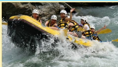
長瀬のラフティング（長瀬町）

長瀬のラフティングは、国指定名勝天然記念物の岩畳や渓谷美を眺めながら、急流あり、静かな瀬ありと変化に富んだコースを楽しむことができます。