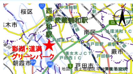
彩湖・道満グリーンパーク

交通：JR埼京線「武蔵浦和駅」下車、 国際観光バス「下笹目」行き「彩湖・道満グリーンパーク入口」より徒歩約5分