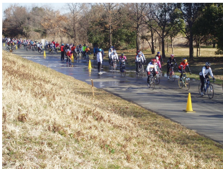
彩湖エンデューロ自転車大会（戸田市）