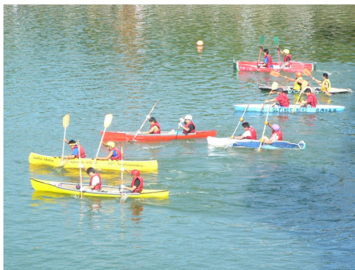
土木学会コンクリートカヌー大会（戸田市）