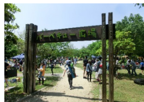
彩湖・道満グリーンパークのバーベキュー広場（戸田市）

彩湖に沿って整備されている「彩湖・道満グリーンパーク」（戸田市）にあるバーベキュー広場では、セットや食材等を各自で用意するため、利用料金や予約が必要なくバーベキューを楽しむことができます。