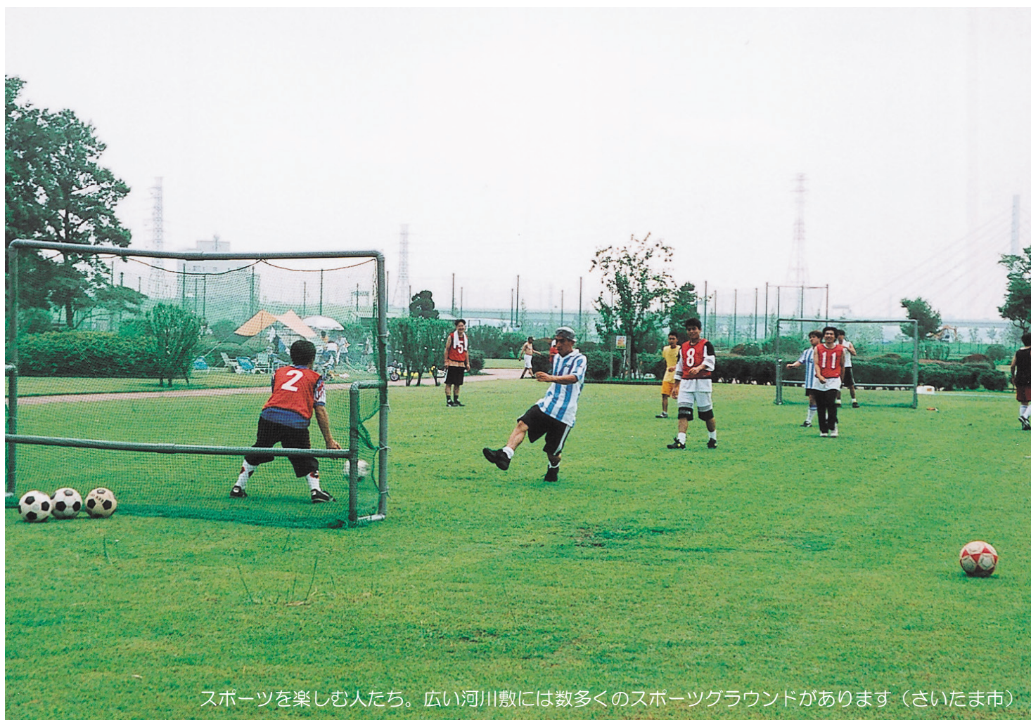
スポーツを楽しむ人たち。広い河川敷には数多くのスポーツグラウンドがあります（さいたま市）