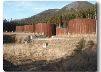
3 久次良地区 (野上沢下流砂防堰堤)