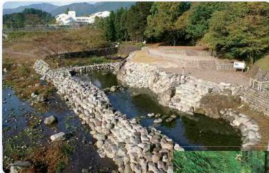
4 大日堂 憾満ヶ淵