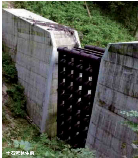
田茂沢第1砂防堰堤