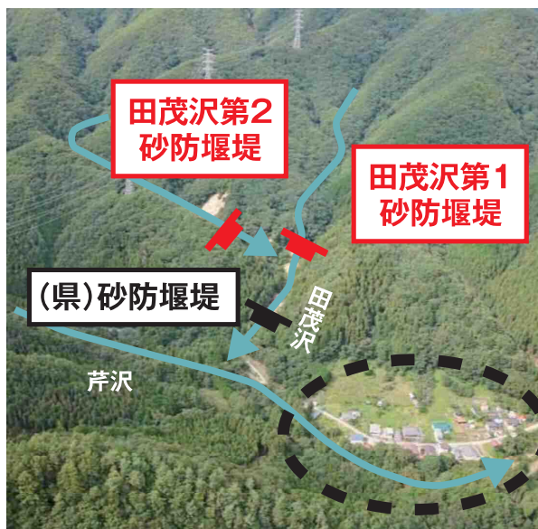
田茂沢下流の集落