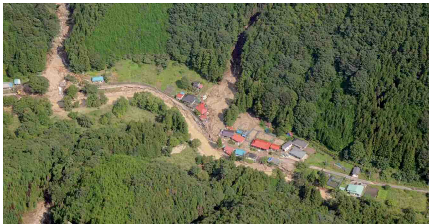
ヘリコプターから確認された被災状況(芹沢地区滝向沢～中坪下沢)