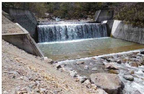
奥鬼怒第三砂防堰堤

奥鬼怒温泉郷日光沢温泉(旧栗山村)では、土石流被害に見舞われました。この災害を教訓として、砂防堰堤を整備しています。