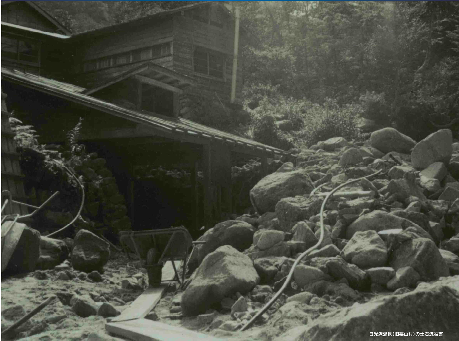
日光沢温泉(旧栗山村)の土石流被害