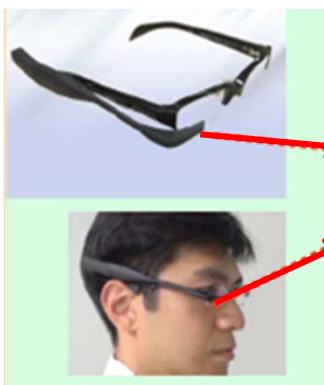
ヘッドマウントディスプレイを用いた施工管理