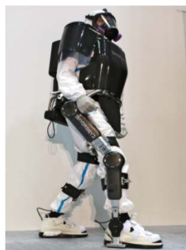
作業用アシストスーツを用いた高効率作業