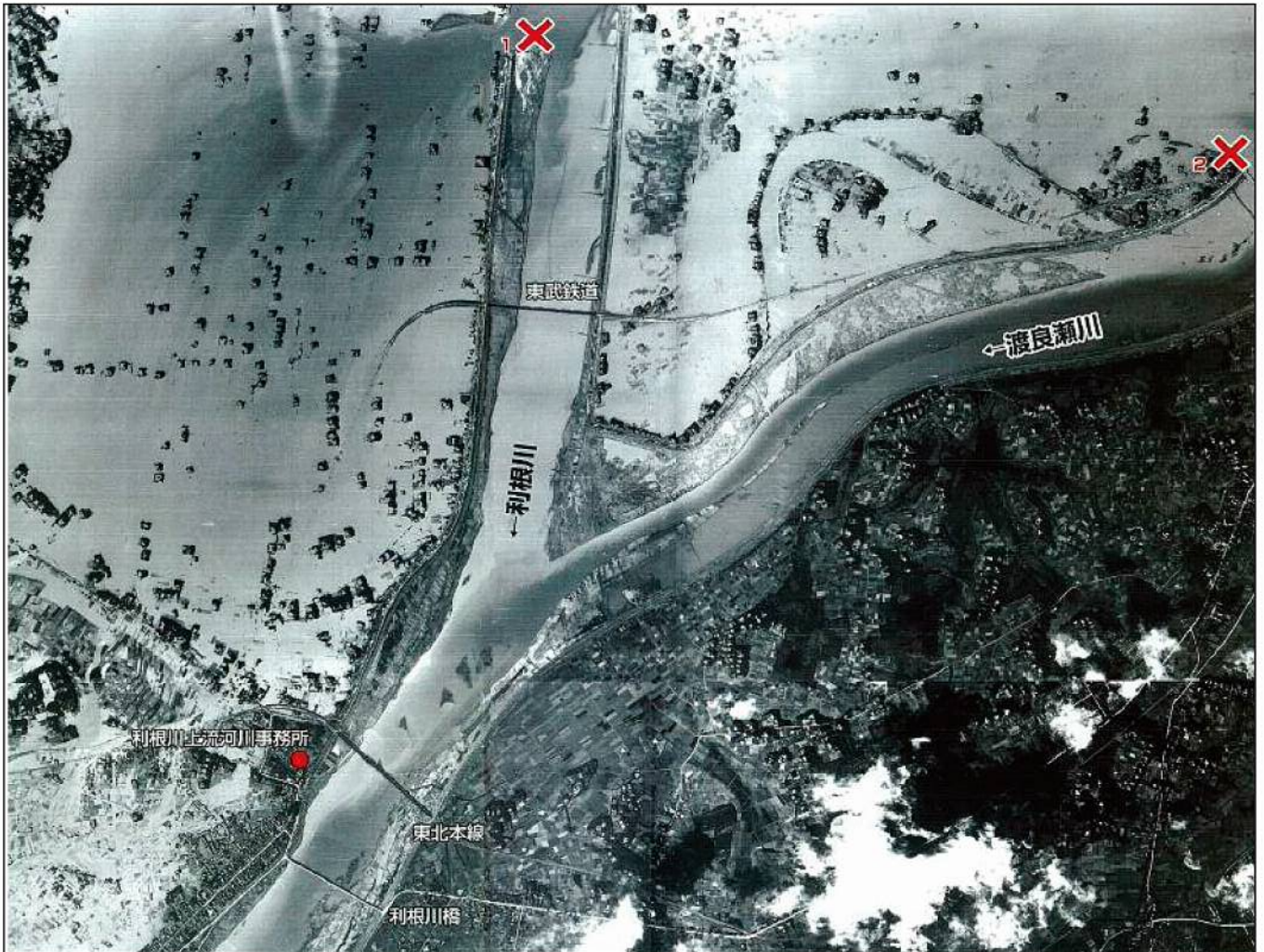
昭和22年9月カスリーン台風による堤防決壊状況