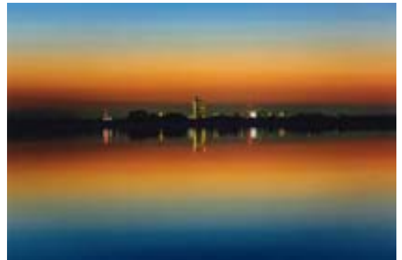
第18回渡良瀬遊水地フォトコンテスト 最優秀賞