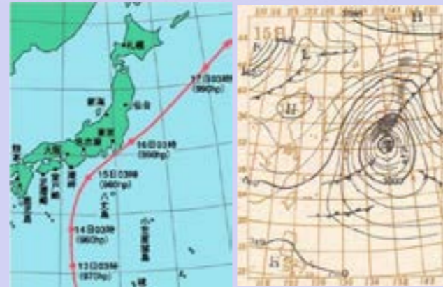
天気図 気象庁資料 (昭和22年9月15日03時)

中でも最大の被害は利根川水系で、利根川及び渡良瀬川では全川に渡り最高の水位を記録、16日零時20分頃、埼玉県東村(現:加須市大利根)新川通地先で利根川右岸の堤防が約350mにわたり決壊しました。