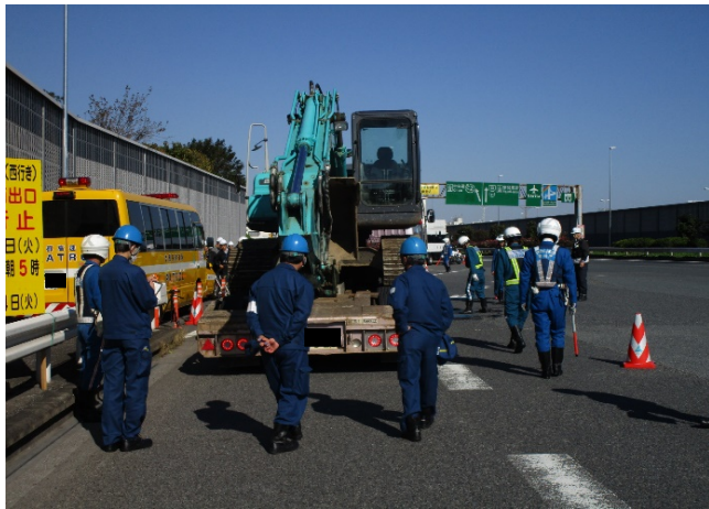
④【首都高速道路(株)/東京運輸支局】大井本線料金所 ＜道路運送車両法と道路法による合同取締風景＞