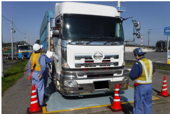
⑤【千葉国道事務所】八千代車両取締基地 ＜違反車両への指導風景＞