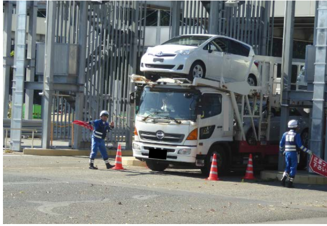
①【中日本高速道路(株)】八王子料金所 ＜特殊車両の引込み風景＞