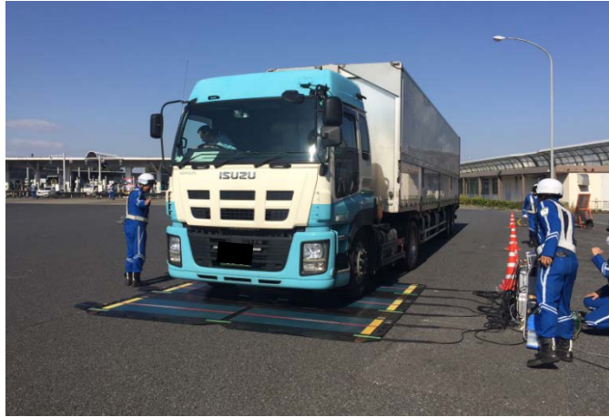
②【東日本高速道路(株)】新座本線料金所 ＜マットスケールによる重量計測風景＞