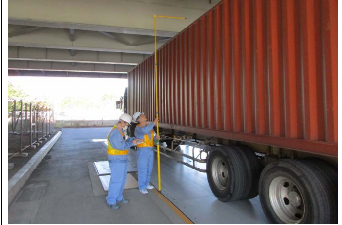
③【東京国道事務所】辰巳車両取締基地 ＜寸法計測風景＞