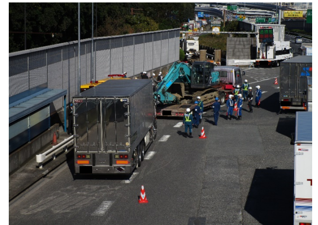
⑥【首都高速道路(株)】大井本線料金所 ＜違反車両の流出風景＞