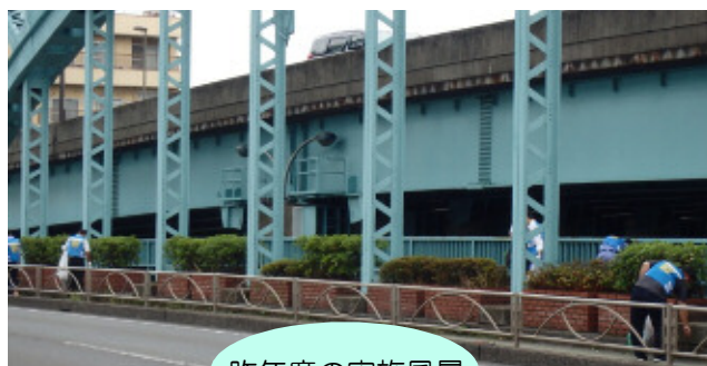
昨年度の実施風景