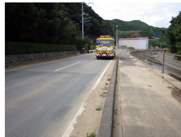
【応急対策班】宇和島市内での路面清掃作業