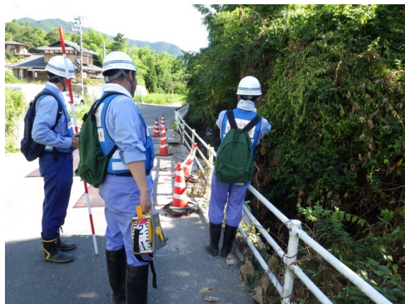
【河川班】熊野町深原川での被災状況調査

■7/22(日) 関東地方整備局 TEC-FORCE 【河川班・砂防班・道路班・応急対策班】活動状況 活動箇所:中国地方整備局管内(広島県東広島市・三原市・熊野町等)