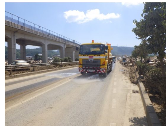
【応急対策班】倉敷市内での路面清掃作業