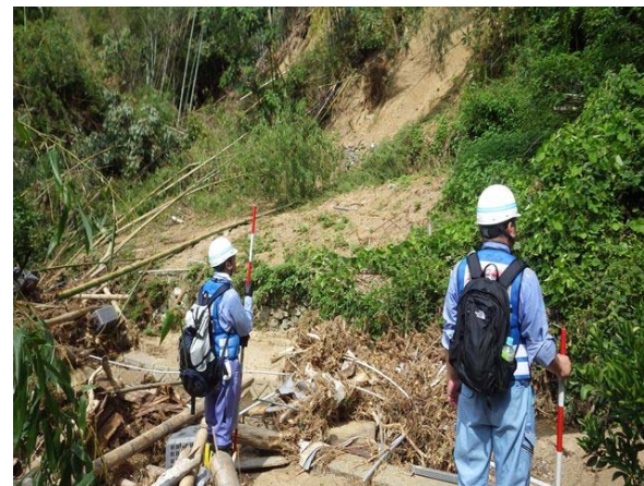
【河川班】宇和島市高城谷川・小名川にて被災状況調査