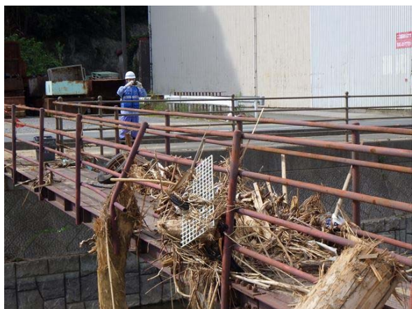
【道路班】宇和島市寺家谷川・白井谷東川にて被災状況調査