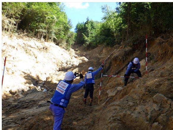
【砂防班】三原市内での被災状況調査