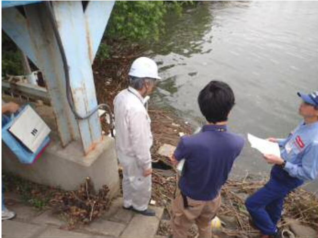
排水樋管の検査状況