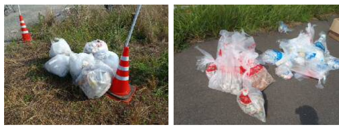
収集したゴミの一例

* H24・28年度は悪天候のため参加者減となりました。 * H26年度は台風8号の接近上陸予想により中止となりました。