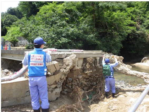
【道路班】岡山県井原市での被災状況調査①