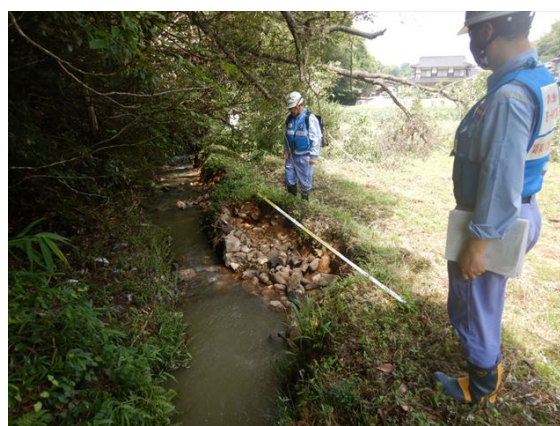
【河川班】岡山県井原市岩倉川での被災状況調査