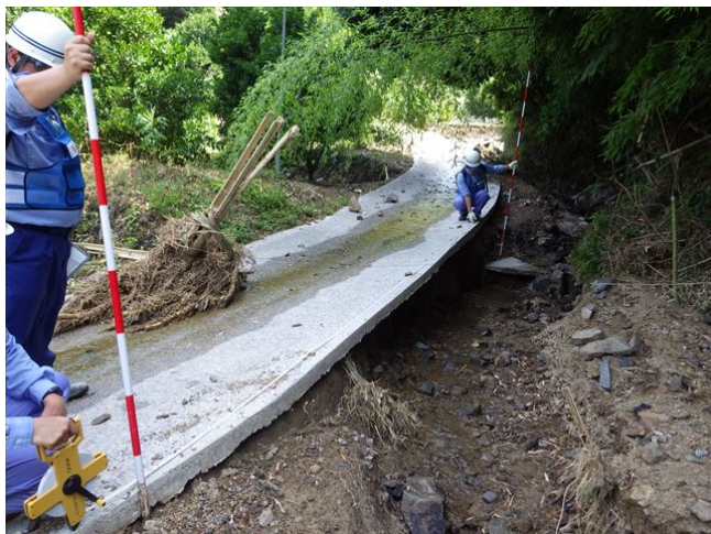
【道路班・河川班】宇和島市吉田町被災状況調査①