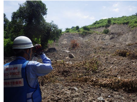
【砂防班】岡山県倉敷市矢部(江田池)での被害状況調査①