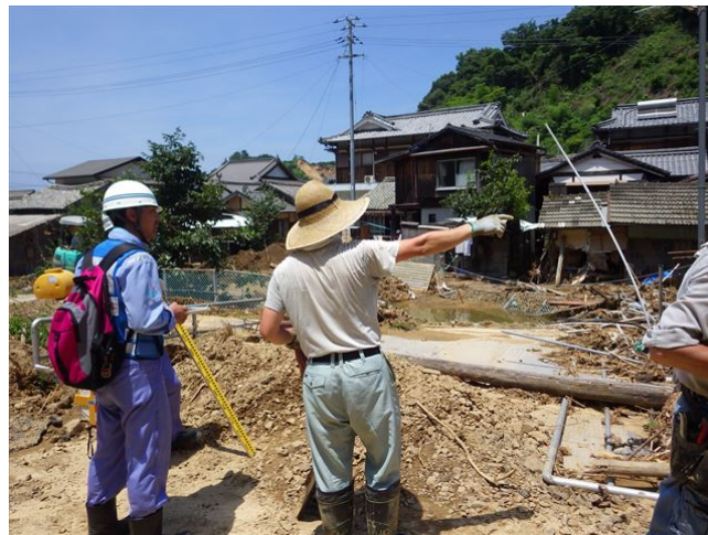
【道路班・河川班】宇和島市吉田町被災状況調査②