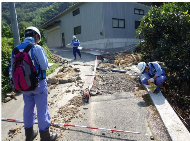
【道路班・河川班】宇和島市吉田町被災状況調査③