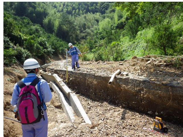
【道路班・河川班】宇和島市吉田町被災状況調査④