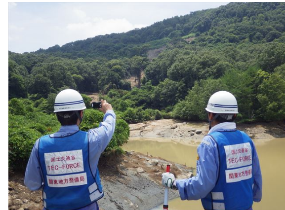
【砂防班】岡山県倉敷市矢部(江田池)での被害状況調査②