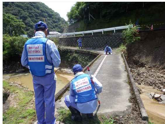
【道路班】岡山県井原市での被災状況調査②