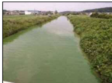
6/22 北浦右岸24km 付近 山田川河口付近 (レベル2)