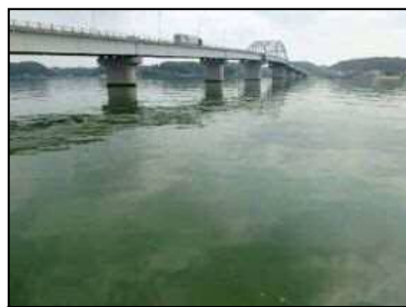
6/26 右岸27km付近 (レベル3)