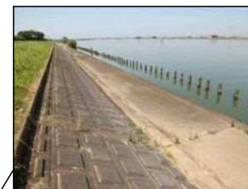
6/25 鱈川左岸2km付近 (レベル2)