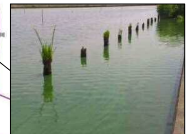
6/22 鰐川左岸2km 付近 (レベル2)