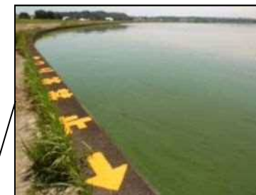
6/25 北浦左岸1km付近 (レベル2)