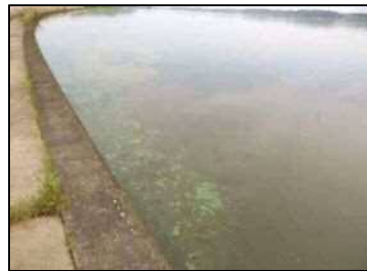
6/22 北浦右岸33km 付近 (レベル2)

【鰐川】 6月22日に左岸2.0k付近でレベル2であった。 【西浦】 アオコの確認はなかった。