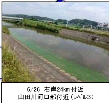
6/26 右岸24km付近 山田川河口部付近 (レベル3)