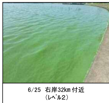
6/25 右岸32km付近 (レベル2)

【北浦】 右岸では、6月25日に24.00k～32.0k付近でレベル1～2が見られ、26日には27.5kと29.0k～30.0k付近にてレベル3が確認された。武田川は6月25日にレベル5となって悪臭があった。山田川では6月26日にレベル3となった。 左岸では、6月25日に1.0k～24.75k付近でレベル1～2を確認した。また鱈川左岸2.0k～5.0k付近においてはレベル2を確認した。その後、6月27日～29日にかけて強風が続いたためレベル1で推移した。 【西浦】 アオコの確認はなかった。