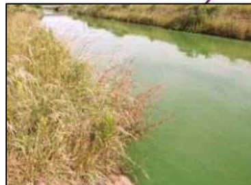
6/22 北浦右岸29km 付近 武田川河口付近 (レベル2)