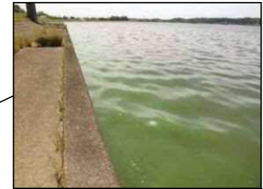
6/7 北浦左岸24km 付近 (レベル2)