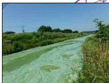
6/25 左岸29km付近 武田川河口部付近 (レベル5)