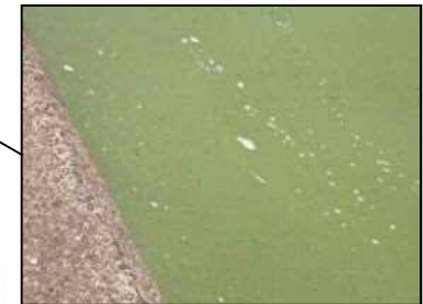
6/7 北浦左岸24km 付近 (レベル2)