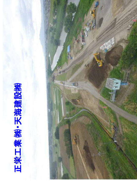
正栄工業(株)・天海建設(株)