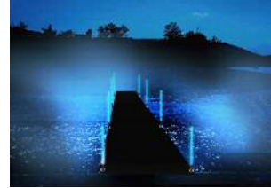
仮設橋へのライトアップ（イメージ）