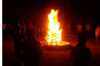
サマーファイヤ（イメージ）