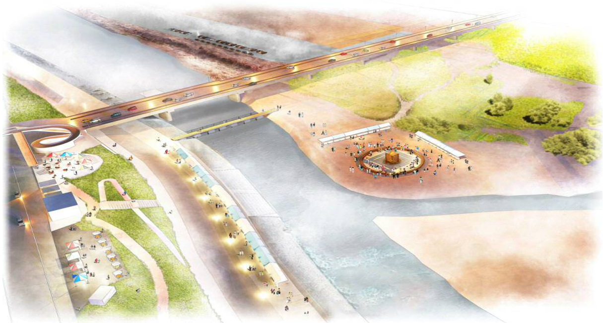
高崎天の川フェスティバル 【イメージ】