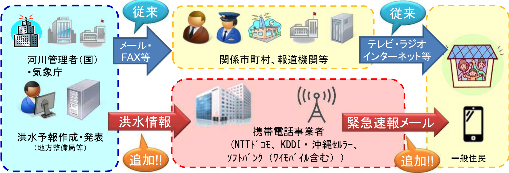
洪水情報のプッシュ型配信イメージ