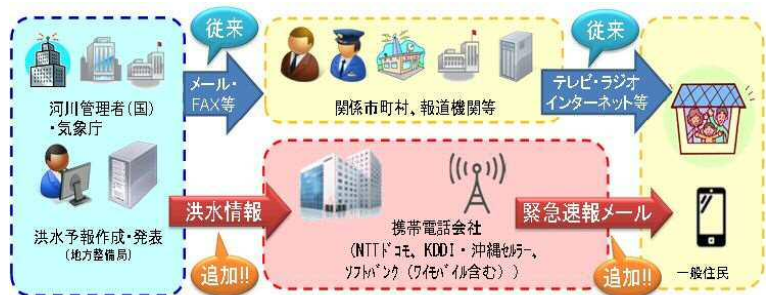
洪水情報の配信イメージ

ワイモバイル： http://www.ymobile.jp/service/urgent_mail/