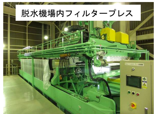
脱水機場内フィルタープレス