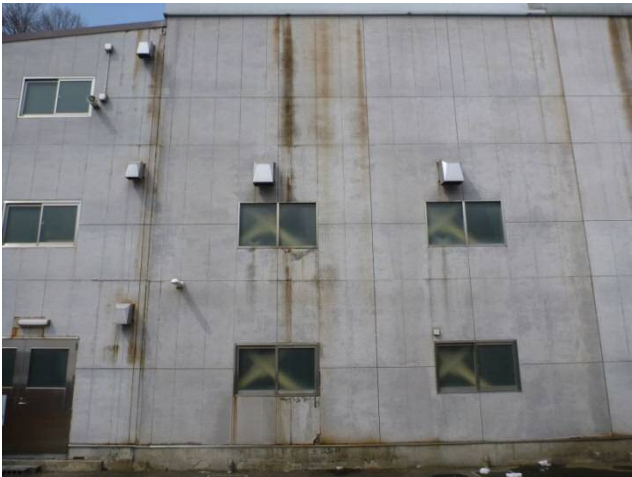
草津中和工場 外壁劣化状況