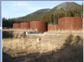
野上沢下流砂防堰堤