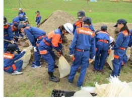
少年消防団・女性消防団による水防活動支援