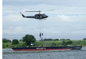
陸上自衛隊による 孤立者救助訓練