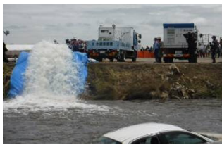
排水ポンプ車による 緊急排水活動