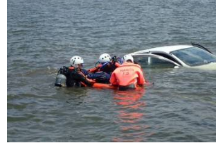
救助隊による 水没車両からの救助訓練