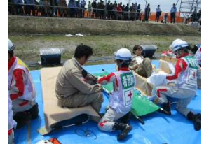
日本赤十字社による 救護訓練