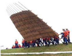
水防団による訓練 （屏風返し工）