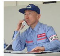
事務所長と栄町長による訓練 （ホットライン）