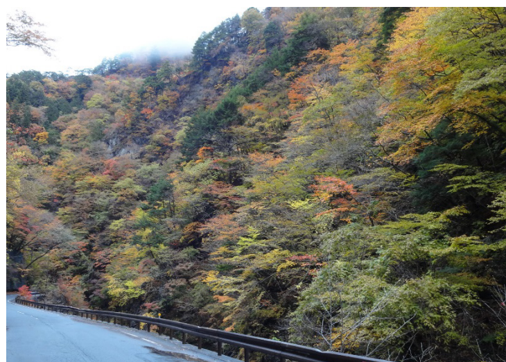
美しく色づく中津峡の山